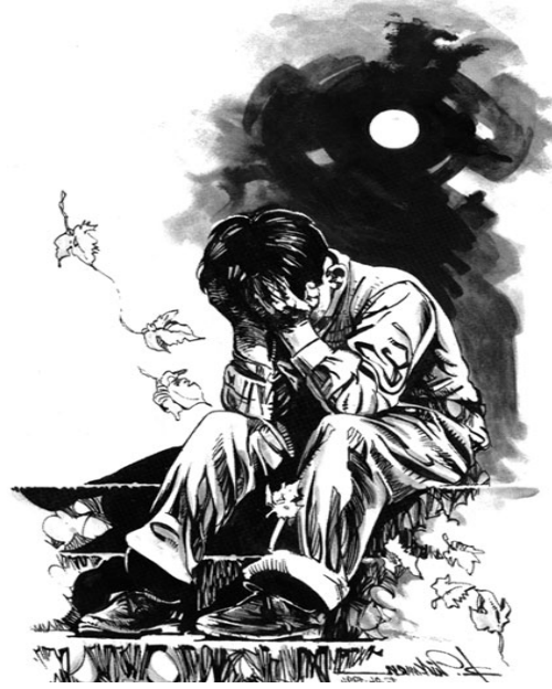
Desen: Ramazan TÜRKMEN