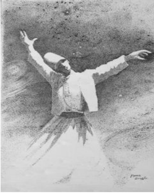
Desen: Kenan EROĞLU