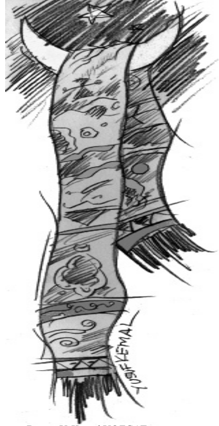
Desen: Y. Kemal YOZGAT

Zaman; saçlarımızı kırık umutlarla tararken, kalplerimizin pencerelerinden içeri sızıp iki isim sundu bize; Bir isyânın gölgesi kadar savruk, “unutma”yı fısıldadı kimimize... Sahibini tanıyan ses âşinâlığında “hatırlamak” dedi bazen de. Her şey ve herkes bu iki istikâmet üzere tayin edildi aslında, tema ve sınırlarıyla. Şekiller müstağni, renkler müstesnâ.