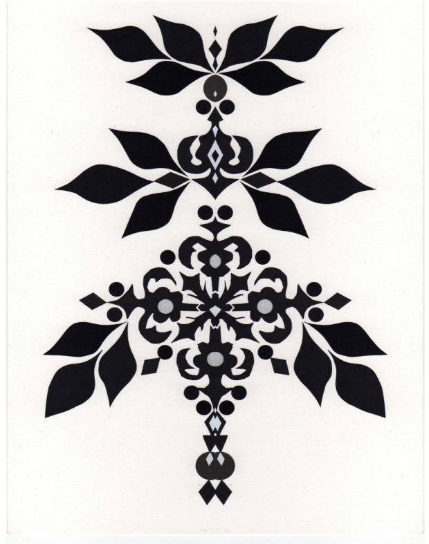
Desen: Üzeyir ÇAYCI

Bu noktadan hareketle, hiçbir medeniyet saf kendi kökleri üzerinde bir varlık oluşturamaz. Dışarıdan etkilenmeler gerçekleştirir. Bu zeminde kendi özgün yaratımı meydana çıkar. Bu sebeple her medeniyetin temelinde güçlü bir felsefi gelenek bulunur. İslam ve Batı medeniyetlerinin temelinde de asla inkarı kabil olmayan bir güçlü felsefe geleneği bulunmaktadır. O zaman kurulacak bir Türk-İslam medeniyet projesinde de felsefeye büyük görevler düşmektedir. Unutulmamalıdır ki, her yıkılan sistem bir arayış içindedir. Batı medeniyetindeki bütün boyutlarıyla bir kriz içerisinde bulunması biz Türklerin hem siyasi ve kültürel hem toplumsal felsefi bir temel aramamız için öncülüğünü beklemektedir.